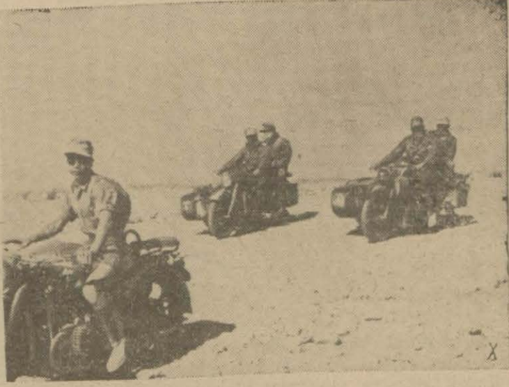
Doğu cephesinde Libyadan iki manzara: Sovyet hatları karşısında Alman nöbetçileri ve şimali Afrikada motosikletli bir Alman müfrezesi